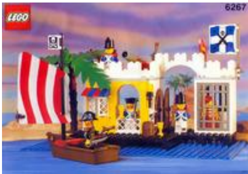
Lagoon Lock-up (1991) – 6267

Tudi tu je prevozno sredstvo rdeč čoln. Za obrambo služi silovit top, dvema vojakoma pa poveljuje častnik s tipičnim klobukom. Senca, ki jo ponuja palma na otoku, pa po vsej verjetnosti služi bolj poveljujočemu, kot vojski.