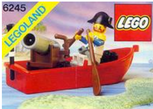
Harbor Sentry (1990) – 6245

V seriji LEGO Pirates, so francoske barve zastopane v sledečih setih: