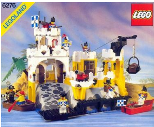
Eldorado Fortress (1989) - 6276

razpolago tudi top nad poveljniškimi prostori, do katerega je možen dostop tudi po palmi. Set je neke vrste križanec med že prej omenjenima setoma 6265 in 6259, ter je zato toliko bolj zanimiv.