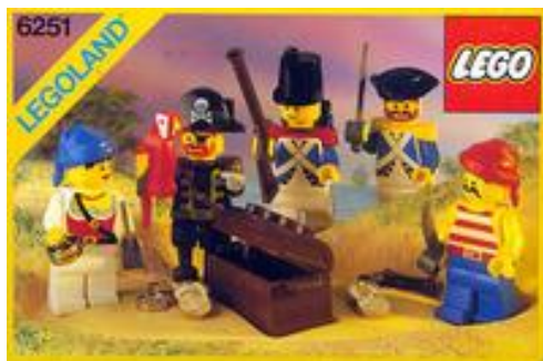
Pirate Mini Figures (1990) – 6251

Za ta set bi velika večina menila, da ni nič posebnega, vendar je LEGO z njim zadel »žebljico na glavico«. Vsebuje 24 elementov in eno figurico, ki predstavlja nek vmesni člen med vojakom in častnikom. Čar tega pristaniškega stražarja sta rdeč čoln in mogočni top. Za tiste, ki morda niste vedeli je LEGO izdeloval topove v dveh izvedbah, in sicer delujočega, za evropski trg (ta je lahko izstrelil okrogli 1x1 stud) in nedelujočega za živeče čez lužo. Blagor nam v Evropi, imeli smo nekaj kar čez lužo niso. Set kot sam, služi povečanju morskih in kopenskih zmogljivosti francoskih pripadnikov, ter najpomembneje - ognjene moči.