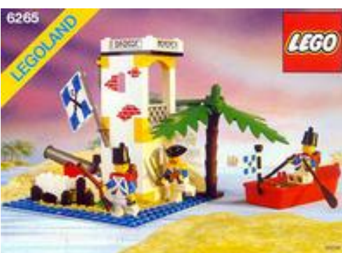
Sabre Island (1990) – 6265

Seveda je varovanje dragocenega tovora brezpredmetno, če nepridiprava, po ujetju ne moreš postaviti na hladno, da razmisli o svojem dejanju. Tako leta 1991 zagleda luč 64 elementov in tri figurice, dva vojaka in en pirat. Barvno monotonost pa razbije papiga in lepo dekoriran zid. Kljub majhnosti, je set mogoče sestaviti na več načinov, zgodb o pobegu morskih volkov pa je bilo že v tistih časih na pretek.