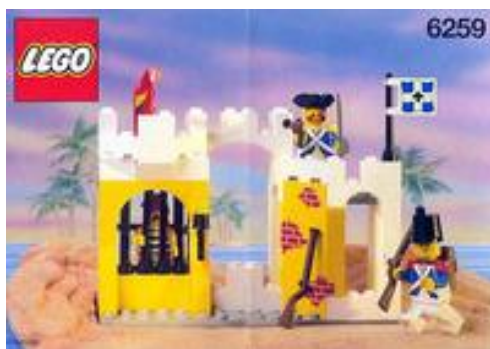
Broadside's Brig (1991) – 6259

V tem setu, ki je podrobneje opisan v prvem delu, se med drugim nahajata tudi dva vojaka.